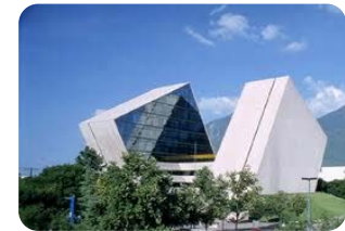
Instituto Tecnológico y de Estudios Superiores de Monterrey, Mexiko