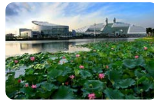
Zhejiang University, China