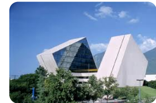
Instituto Tecnológico y de Estudios Superiores de Monterrey, Mexiko