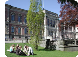
University of Michigan – Shanghai Jiao Tong University Joint Institute, China