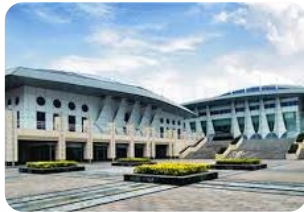
Northwestern Polytechnical University, China