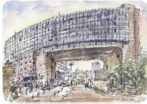
Hongik University, Korea